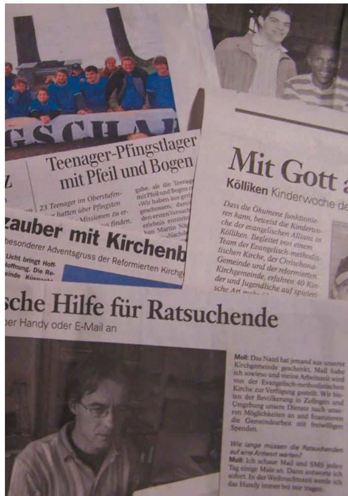
Einzelne Pfarrer und Freikirchen erreichen oftmals ein besseres Resultat als ihre Chefs und Pressesprecher.